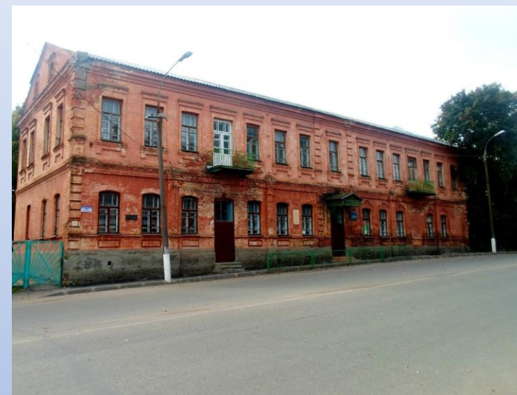
Невельский филиал Адрес: г. Невель, ул. Комсомольская, д.4 тел. 8(81151)24623