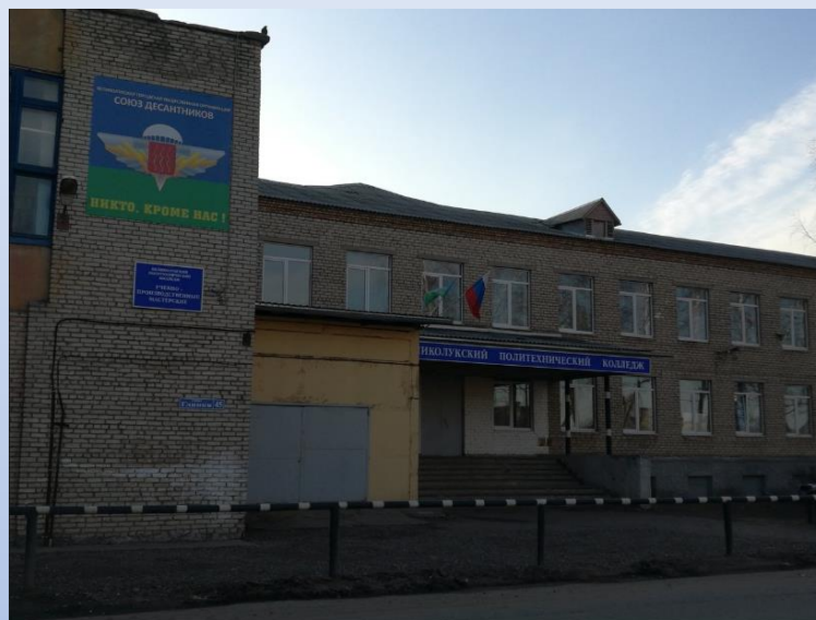
3 отделение Глинки, д.45; тел.8(81153) 9-27-38